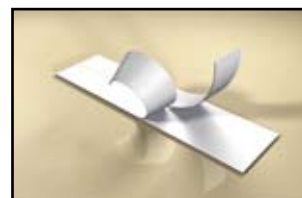
Étiquettes à support prédécoupé, facile à décoller