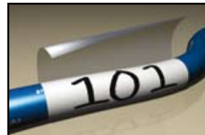
Markierung von Drähten und Kabeln