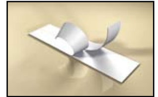
Einfach abzulösende Etiketten mit Rückenschlitzung