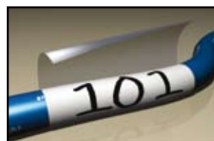
Afmærkning af ledninger og kabler