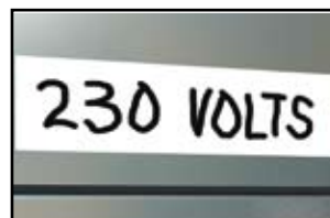
Mærkning til alment brug

Alle RHINO etiketter er superstærke og udviklet til at holde i længden. Takket være anvendelsen af lim, udviklet specielt til industrien, vil de opfylde alle dine krav til holdbarhed. Med RHINO 101 kan du være sikker på, at du anvender holdbare RHINO etiketter i specialdesignede og letanvendelige patroner.