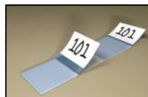
Udstansede etiketter, der er nemme at adskille